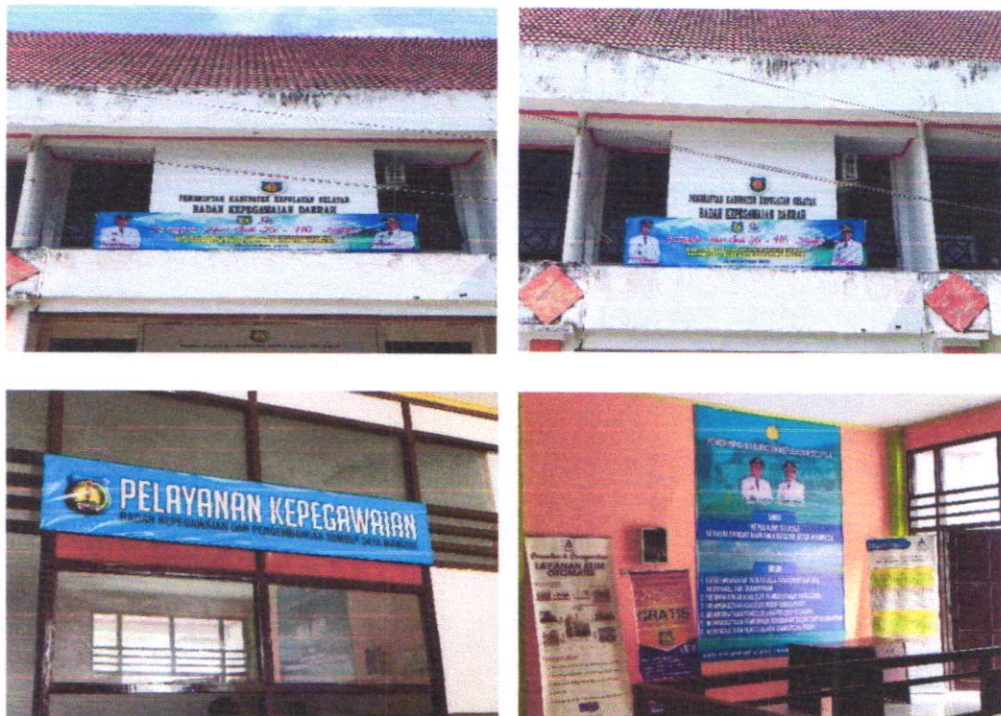
Gambar 1.1 FOTO KANTOR BADAN KEPEGAWAIAN DAN PENGEMBANGAN SUMBER DAYA MANUSIA

BKPSDM Kabupaten Kepulauan Selayar merupakan instansi pemerintah Tipe A yang beralamat di Jalan Jenderal Ahmad Yani Nomor 1 Benteng, terletak di koordinat -6.1208390 Lintang Selatan dan 120.4666590 Bujur Timur, dengan alamat email bkppd@kepulauanselayarkab.go.id .