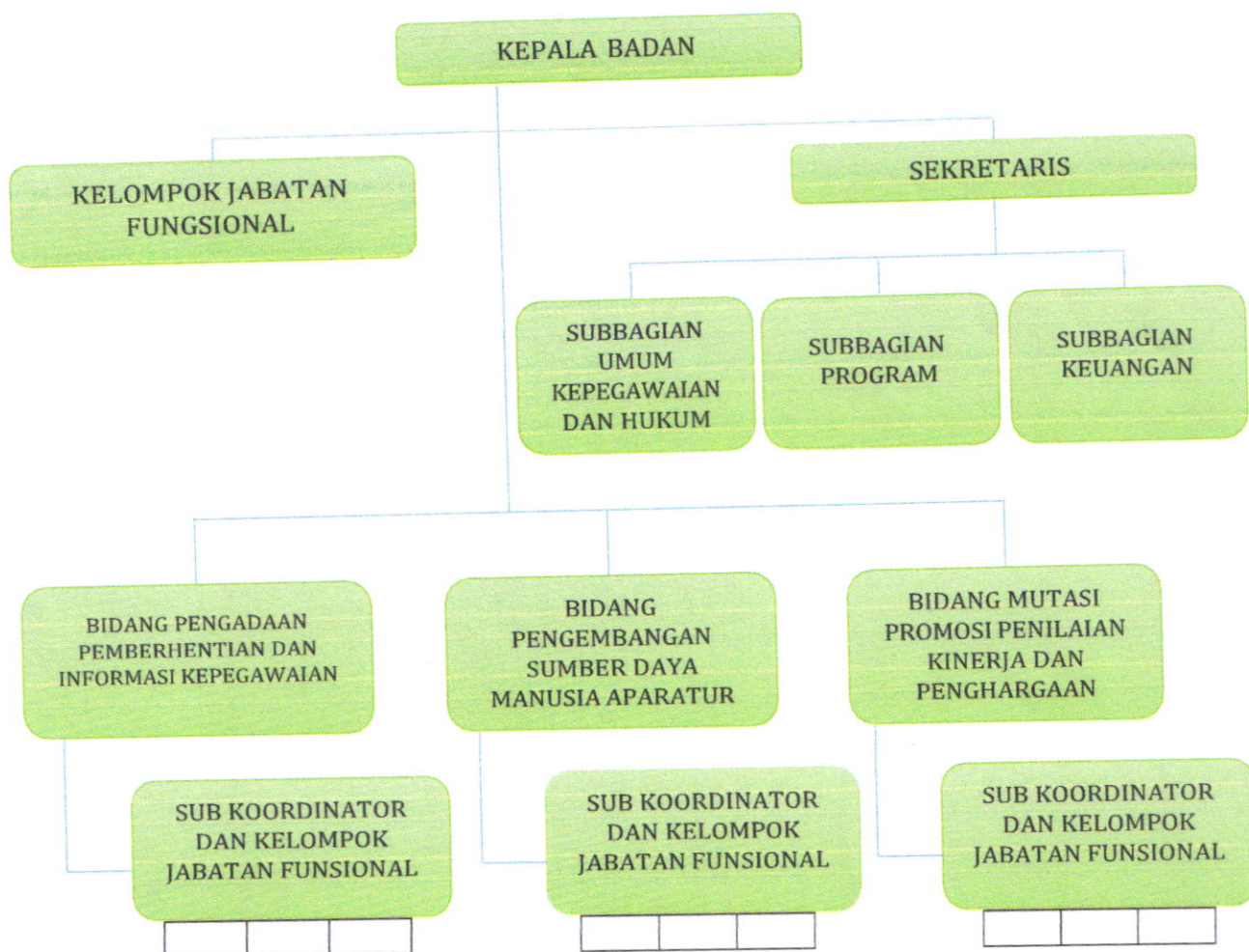
Gambar 1.2 STRUKTUR ORGANISASI BADAN KEPEGAWAIAN DAN PENGEMBANGAN SUMBER DAYA MANUSIA

Dalam bentuk bagan, Struktur Organisasi Badan Kepegawaian dan Pengembangan Sumber Daya Manusia Kabupaten Kepulauan Selayar dapat dilihat pada Gambar 1.2 :